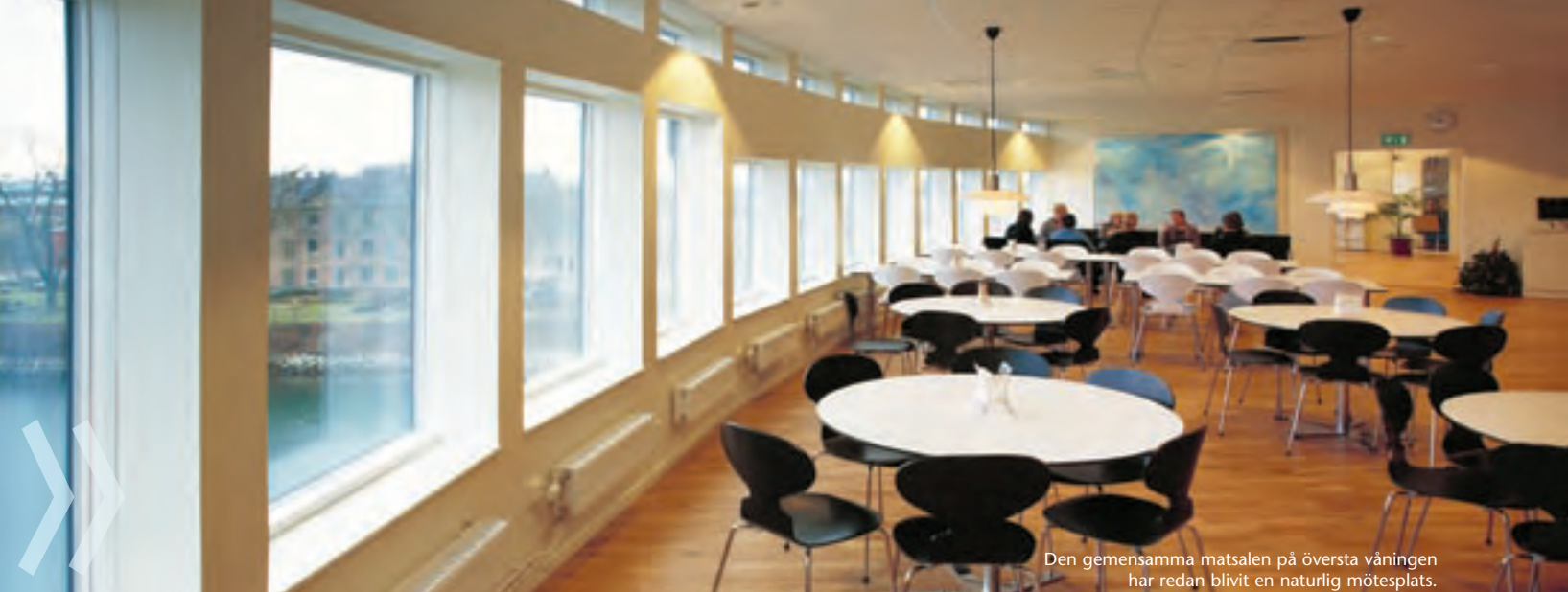
Den gemensamma matsalen på översta våningen har redan blivit en naturlig mötesplats.

skrymslen och vrår. Det som inte ögat kan se från reception och vaktmästeri fångas av övervakningskameror.