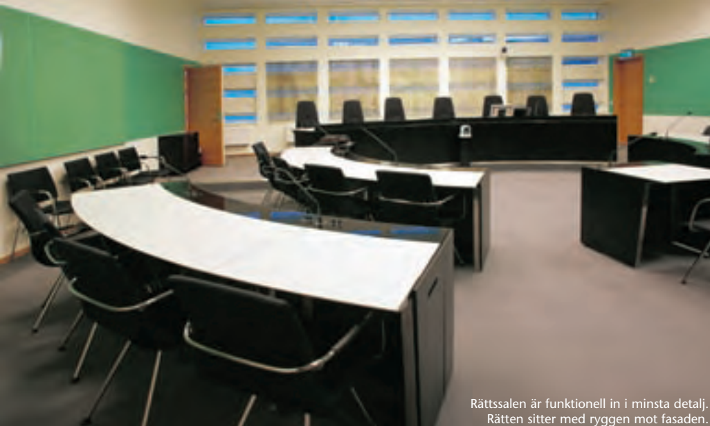
Rättssalen är funktionell in i minsta detalj. Rätten sitter med ryggen mot fasaden.