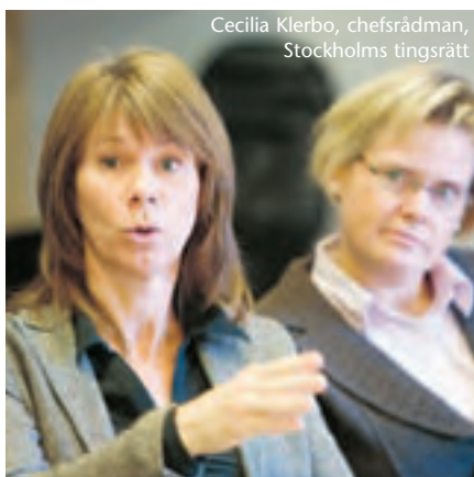
Cecilia Klerbo, chefsrådman, Stockholms tingsrätt