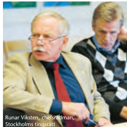
Runar Viksten, chefsrådman, Stockholms tingsrätt